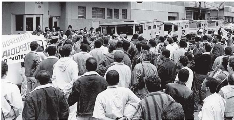
TRANSVALOR - Uma de nossas greves, em 1995, parou a empresa na Baixada do Glicério