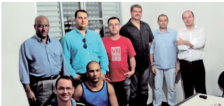
Diretores do SindForte e Comissão de Trabalhadores da Prosegur, em Rio Preto

Internacional - Nosso Sindicato reuniu-se com sindicalistas do setor de carro-forte da Espanha e da vigilância privada da Suíça, Panamá e Chile, que visitaram São Paulo dias 24 e 25 de fevereiro, para conhecer as condições dos trabalhadores da Prosegur no Brasil.