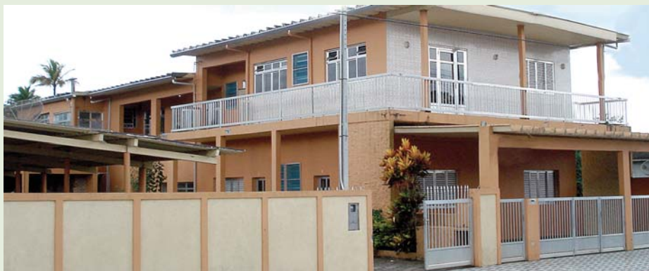
BERTIOOGA - Primeira Colônia de Férias do Sindicato, na Praia da Enseada

Para se ter uma ideia da procura, recebemos em 2011 mais de 740 pedidos de reserva. O número cresceu muito, cerca de 72%, em rela-