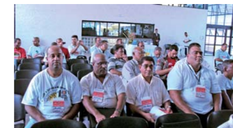
SindForte presente na 9ª Conferência

Dezembro - O Sindicato esteve na 9ª Conferência Nacional da categoria, que reuniu dirigentes sindicais dos vigilantes em Camaçari (Bahia), dias 12 e 13. A reposição das perdas salariais, ganho real e Piso único nacional serão as bandeiras das próximas campanhas salariais em todo o País.