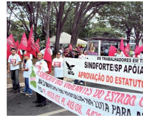
2ª MARCHA - Nosso Sindicato teve papel de destaque na Marcha que levou cerca de 2 mil vigilantes a Brasília. Protesto na Esplanada dos Ministérios e ato no Congresso Nacional fortaleceram nossas reivindicações

Os sindicalistas defenderam projetos que tramitam no Congresso Nacional, propondo a aprovação de leis que visam garantir condições de trabalho dignas para os vigilantes, como