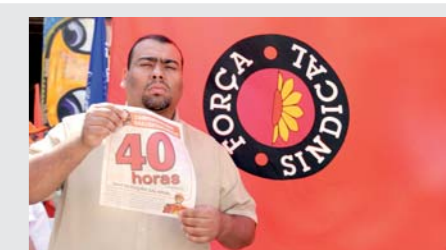
Diretor Titanic, em ato da Força

2010 - O Brasil crescerá outra vez. Vamos fortalecer a mobilização por mais conquistas. E a luta já está acontecendo, pois a data-