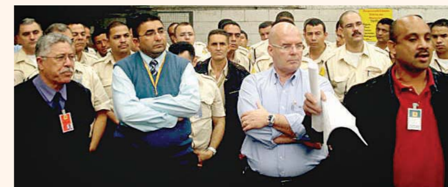
NÃO PAGOU, PAROU - Greve garante pagamento correto da PPR na Prosegur

PPR na Prosegur - Depois de várias reuniões em nossa sede, o SindForte firmou acordo que garante a aplicação do Programa de Participação nos Resultados (PPR) na Prosegur. Em vigor desde 21 de setembro, o acordo prevê que o benefício pode chegar até a um Piso salarial, referente ao