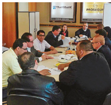
Negociação fecha acordo com ganho real

Funcionou unificar as negociações. As campanhas conseguiram