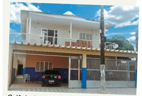
Colônia 1 pode ser usada por sócios

Enquanto a reforma durar, sócios e dependentes poderão usar a Colônia 1. Utilize. Você tem direito.