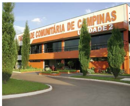
Fachada da Unidade 2, localizada no Parque Via Norte. A FAC possui quatro campi em Campinas

O Sindicato conseguiu para sócios e dependentes 100 bolsas de estudo com desconto de 50%. Importante: o desconto vale para toda a duração do curso.