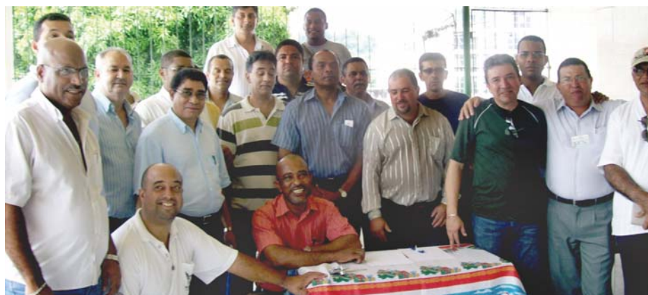
Diretores e fundadores da Federação nacional, dia 13 de março

Sindicatos - A própria fundação da entidade, dia 13 de março, no Rio de Janeiro, além da participação efetiva dos Sindicatos fundadores, teve presença do Sindicato de Vigilantes do Rio. Vale registrar que vários Sindicatos da patrimonial, cuja representação inclui também a escolta, forneceram