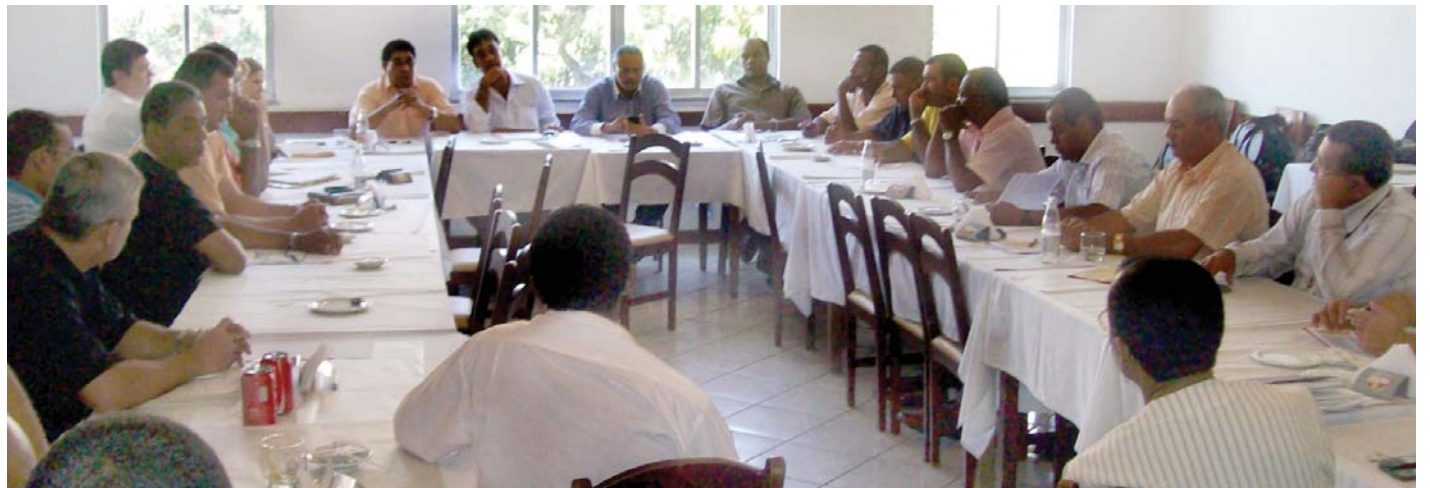
FUNDAÇÃO - Foto histórica registra reunião de sindicalistas para a fundação da Federação nacional, dia 13 de março