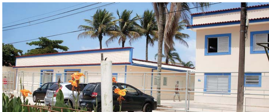
BERTIOGA - SindForte dispõe de 30 apartamentos à disposição de sócios e dependentes