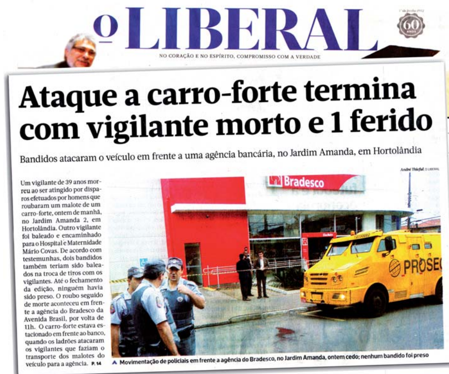
VIOLÊNCIA - Ataque a carro-forte em Hortolândia no mês de junho resulta em morte de vigilante

questraram vigilante da Transbank e sua família, amarraram falsa bomba em sua perna, para tentar roubar um carro-forte.