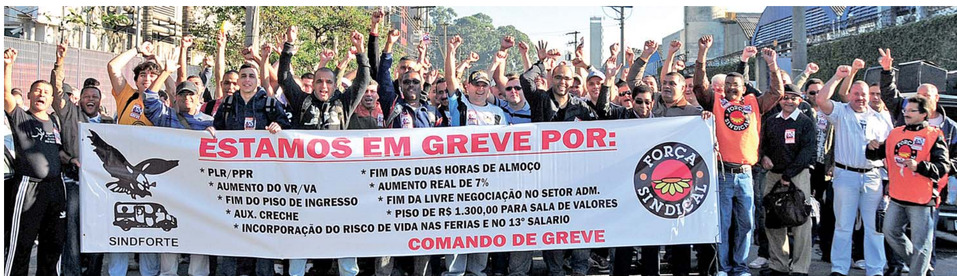
GREVE VITORIOSA - A paralisação das empresas de carro-forte mobilizou os trabalhadores nas principais bases da Grande São Paulo e região de Campinas. Na foto, vigilantes em frente à Protege

Companheiro(a): os trabalhadores no transporte de valores estão de parabéns. A paralisação, comandada pelo Sindicato, dia 2 de julho, foi vitoriosa.