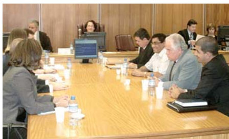
3 DE JULHO - Audiência de conciliação no TRT