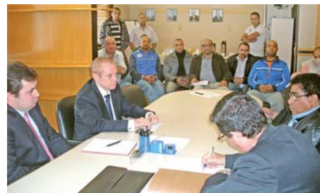
13 DE JUNHO - Rodada no sindicato patronal

Em duas audiências, dias 3 e 5 de julho, os empresários mantiveram a intransigência. Assim o dissídio foi a julgamento, dia 30, culminando com nossa vitória.