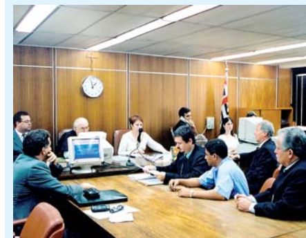
2003 - Acordo no TRT garante 15%

Até 2003, o trabalhador em escolta nada recebia de Adicional de Risco de Vida. A situação começou a mudar em 2002, quando nosso Sindicato (SindForte) passou a representar a categoria.