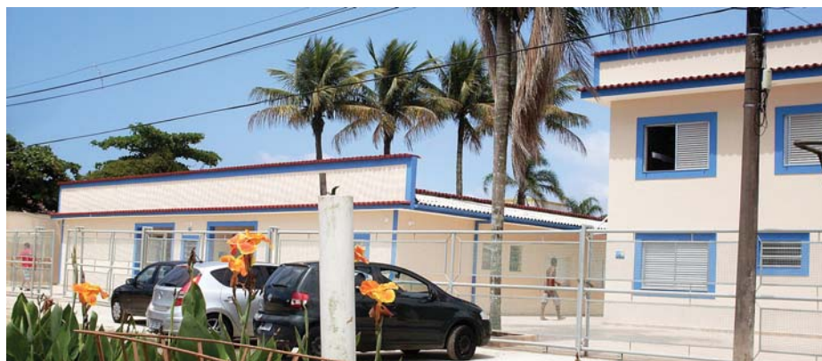
BERTIOGA - Associados tem 30 apartamentos de alto padrão para seu lazer e descanso

Sorteio - O Sindicato optou por não sortear as vagas para o Carnaval, porque não houve comprometimento de sócios no sorteio