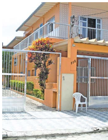
PRIMEIRA COLÔNIA - Inaugurada em 2009, tem 12 apartamentos

Carnaval - Não perca tempo. Corra, porque o Carnaval está aí!