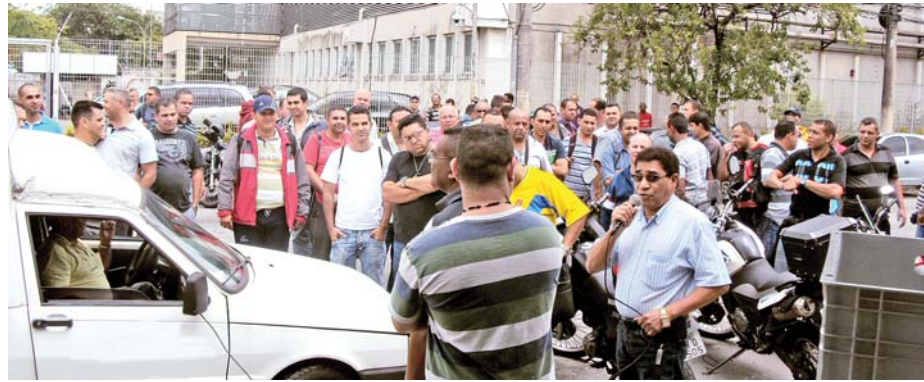
FEVEREIRO - Mobilização na garagem da Protege abre caminho para conquista da PLR