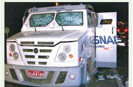
ASSALTOS - Chega de violência e mortes!

Em outro caso, em maio, criminosos mantiveram reféns a mulher e as duas filhas, uma de 13 e outra de 10 anos, de um vigilante da RRJ.