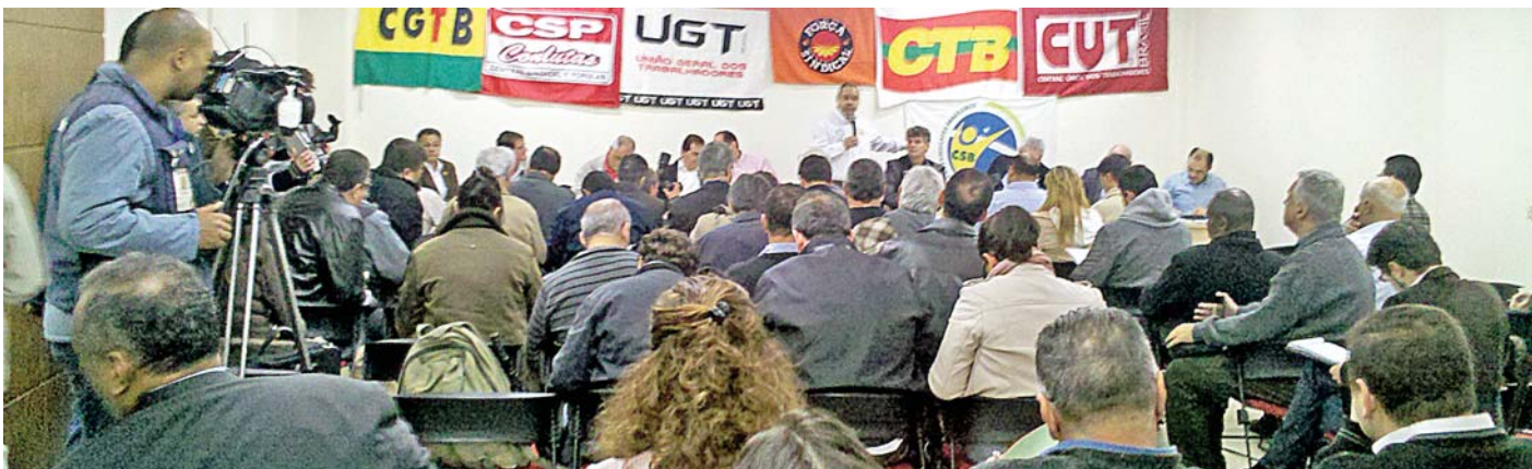
MOBILIZAÇÃO NACIONAL - Centrais Sindicais se reúnem dia 25 de junho, na sede da UGT. No encontro, decidem convocar manifestações

As Centrais Sindicais convocaram o “Dia Nacional de Luta com Greves e Mobilização”, que reunirá milhares de trabalhadores em atos e manifestações no dia 11 de julho (quinta-feira).