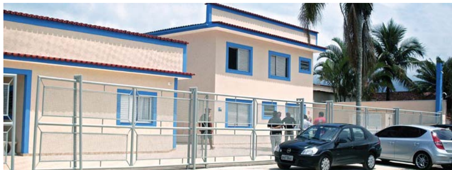
COLÔNIA II - Pavilhão destelhado durante vendaval passou por completa reforma

Reforma - O pavilhão avariado teve que ficar 15 dias interdita-