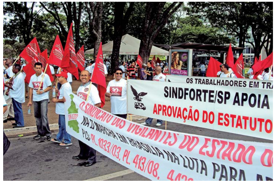
Vigilantes cobram aprovação da lei do Adicional de 30% na 2ª Marcha a Brasília, em 2009

ANOS E ANOS DE LUTA - Somos o primeiro Sindicato do Brasil que conquistou 30% do Adicional de Risco de Vida para os vigilantes do transporte de valores. Essa conquista foi arrancada em 1994, após uma forte greve. De lá para cá, o Sindicato buscou levar esse benefício para os demais companheiros do transporte de valores e também para quem trabalha na escolta armada. A primeira conquista de Adicional na escolta aconteceu em 2004. Começamos com 15%.