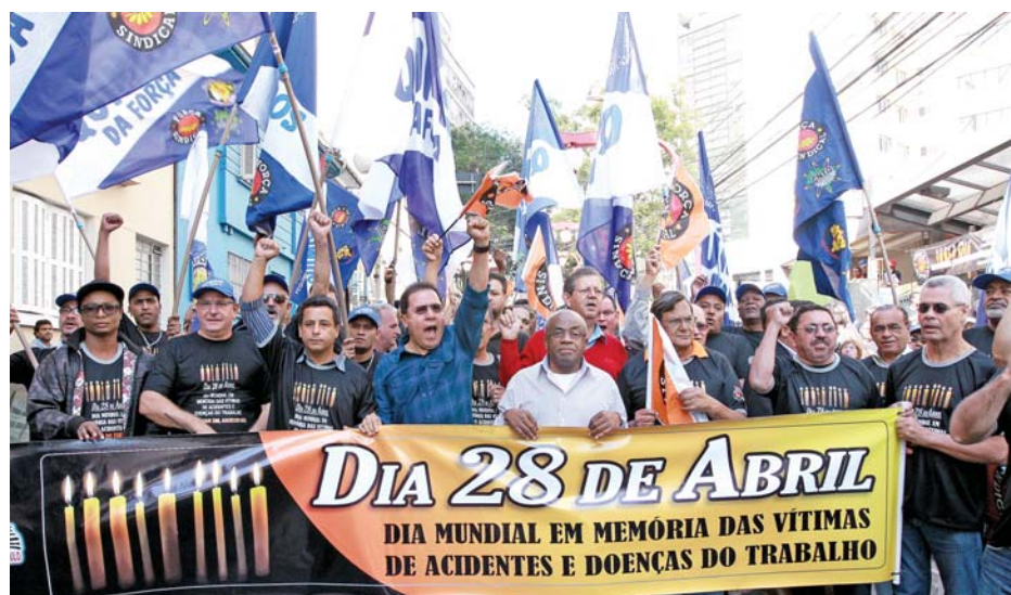
ACIDENTES - Trabalhadores protestam contra sucateamento do Ministério do Trabalho

Centenas de trabalhadores de várias categorias se reuniram dia 26 de abril, no Sindicato dos Metalúrgicos de São Paulo, em memória às vítimas de acidentes no ambiente de trabalho. O evento foi organizado pela Força Sindical.