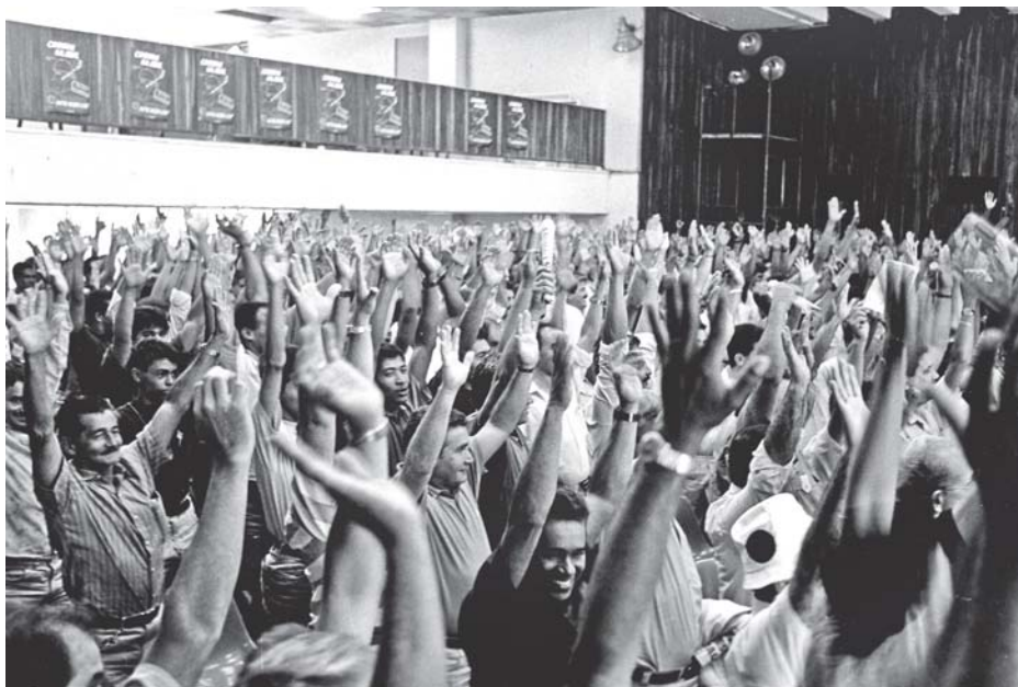
Assembleias e mobilizações a partir de 1992 iniciaram luta pelo Adicional de Risco de Vida

Benefício integral contempla todos os vigilantes de carro-forte e de base