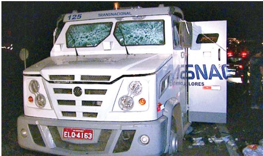
TERROR NA ANHANGUERA - Criminosos estavam armados com fuzis, munições antiaéreas e dinamite. Veículos foram totalmente danificados

Assalto - Os dois carros-fortes foram obrigados a parar, por cer-