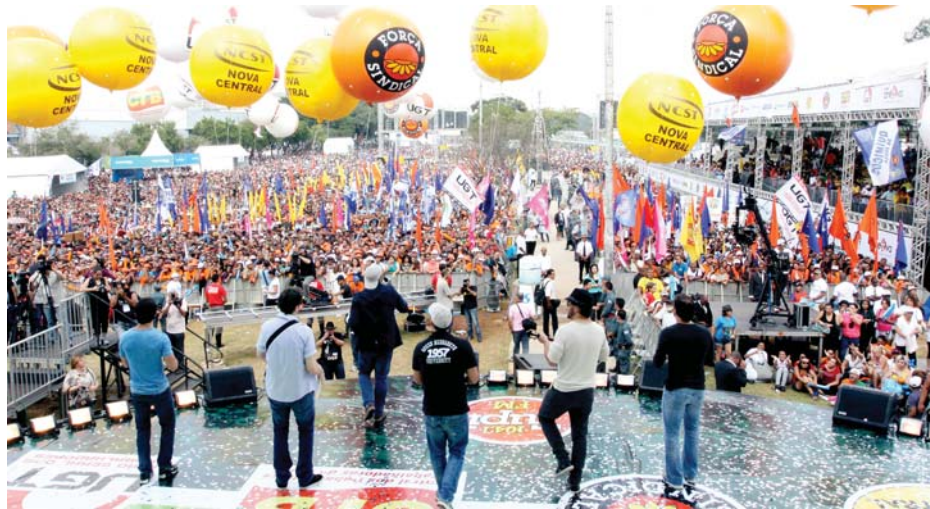
CAMPO DE BAGATELLE - Shows de artistas populares animam festa do Dia do Trabalhador

Direitos - O 1º de Maio de 2013 teve como tema a Consolidação