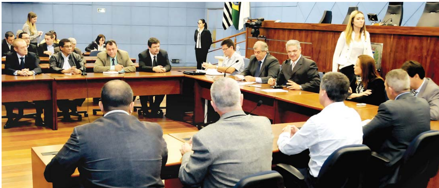
CÂMARA MUNICIPAL - Audiência cobrou das autoridades combate ao crime organizado e mais fiscalização nas rodovias

também reiterou a necessidade de reforçar o policiamento nas principais rodovias do Estado.