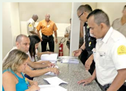
PROSEGUR - Eleição realizada dia 27