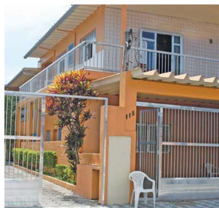
Colônia I - Adquirida pelo Sindicato em 2009

Cuidado - O Sindicato não se responsabiliza por pertences deixa-