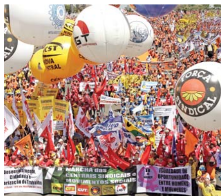
2013 - Mais de 50 mil participaram da 7ª Marcha

Sob o lema “Trabalhadores unidos por mais direitos e qualidade de vida”, a 8ª Marcha da Classe Trabalhadora sairá da Praça da Sé, às 10 horas, e seguirá até o vão livre do Masp, na avenida Paulista.