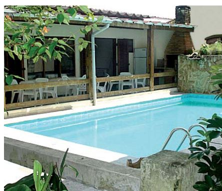
Piscina é um dos atrativos da Colônia II

dos pelos hóspedes ao lado da piscina e em outras áreas comuns de circulação das pessoas.